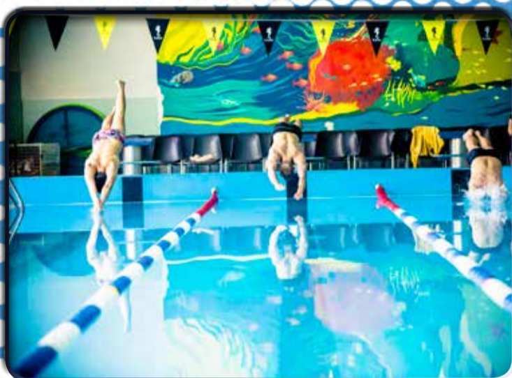
Fot. Remigiusz Naruszewicz