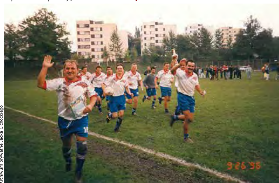
9 26 35