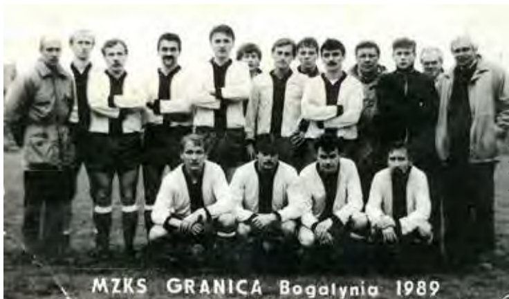
MZKS GRANICA Bogatynia 1989