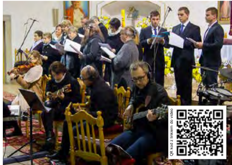
QR kod z linkiem do wideo

Liczne zgromadzeni w kościele mieszkańcy Bogatyni mieli niepowtarzalną okazję wysłuchania kilkunastu energetycznych, melodyjnych utworów, które powstały do słów „Dzienniczka” św. siostry Faustyny Kowalskiej, a któ-