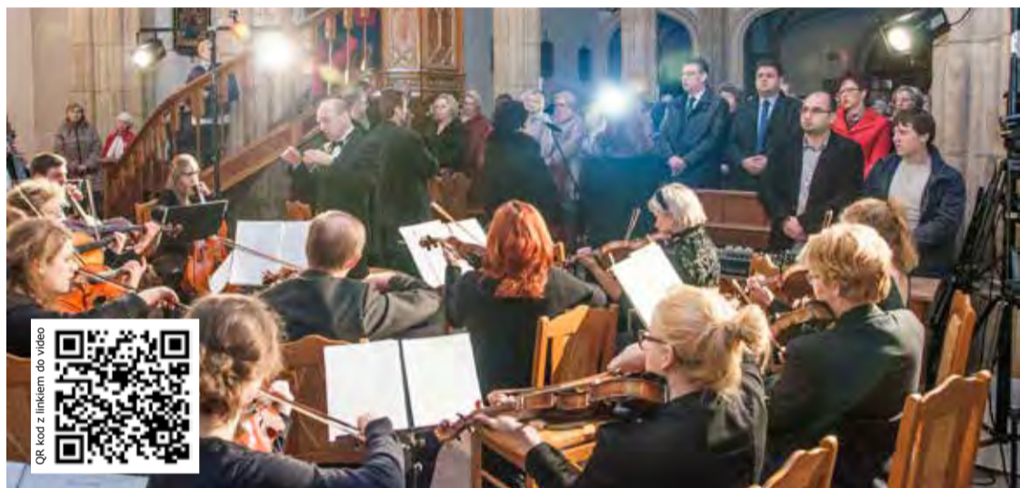
QR kod z linkiem do wideo