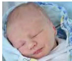
Beniamin Ryba 14 marca 2016