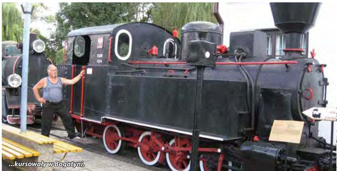
...kursowały w Bogatyni.