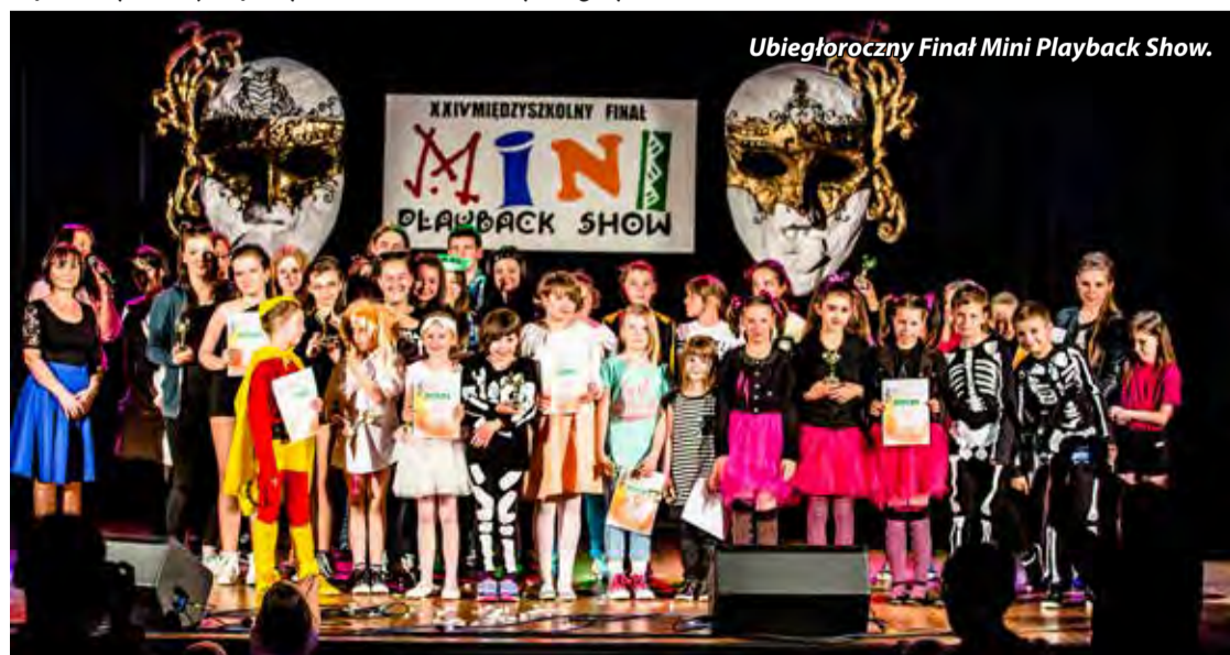
Ubiegłoroczny Finał Mini Playback Show.

zapraszamy dzieci i młodzież do udziału w konkursie, a rodziców i opiekunów do gorącego dopingowania występów swoich pociech. Organizatorem konkursu jest Bogatyński Ośrodek Kultury. Zapraszamy! Wstęp wolny.