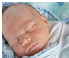
Nikodem Lückmann 21 marca 2016