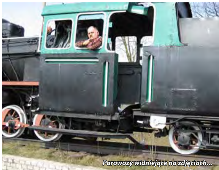
Parowozy widniejące na zdjęciach...