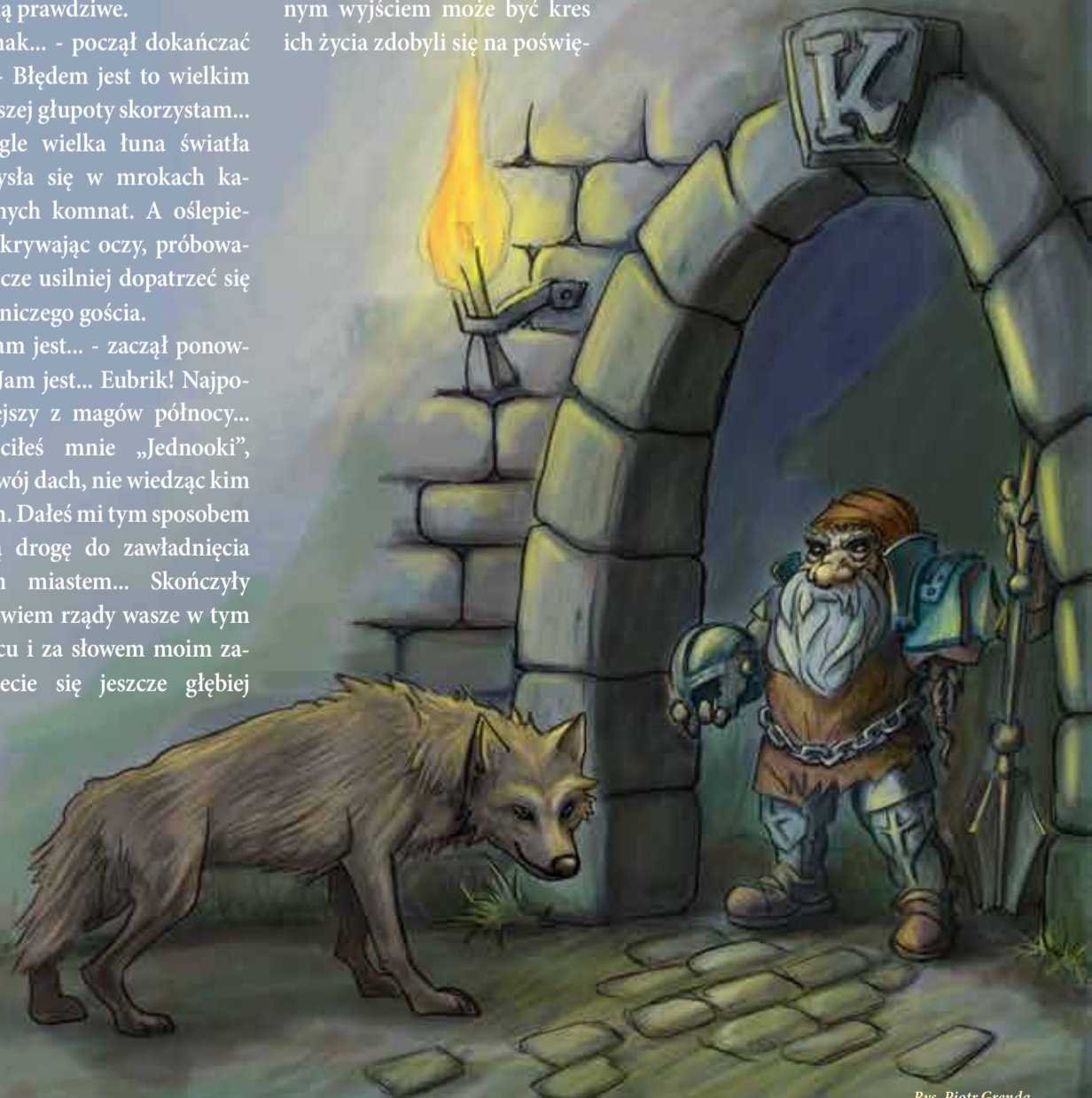
Rys. Piotr Grenda