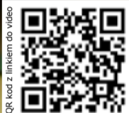
QR kod z linkiem do video