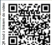
QR kod z linkiem do video